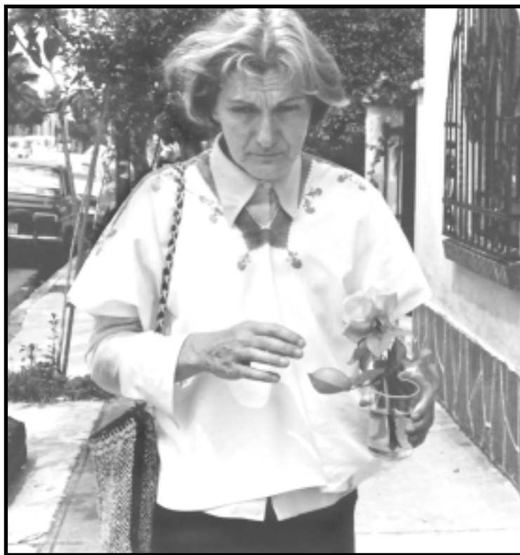
De casa en casa con su bolso al hombro. México, 1975

membretes de las cartas que guardan sus hermanas, y por las historias que están alrededor y fuera de las cartas, se puede seguir la pista de Alcira en los primeros años mexicanos ahora borrosos: en Internet, fechada en 1956, está su tesis para el CREFAL sobre "La recreación en la estructura de la personalidad"; se sabe que trabajó también en el Instituto Latinoamericano de Cinematografía Educativa y en comunidades rurales, y que extiende la beca para estudiar pintura en Guanajuato. En 1960 se casa con un médico de la Cruz Roja. Puede creerse que fue el tipo de amor que nada cura, una obtusa invasión en la intimidad. En 1962 acaba para siempre con